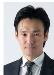
中小企業診断士・ 社会保険労務士

変化に対応して、企業が成長し成果を出していくために、企業の現状に合った人材育成のご提案をさせていただきます。